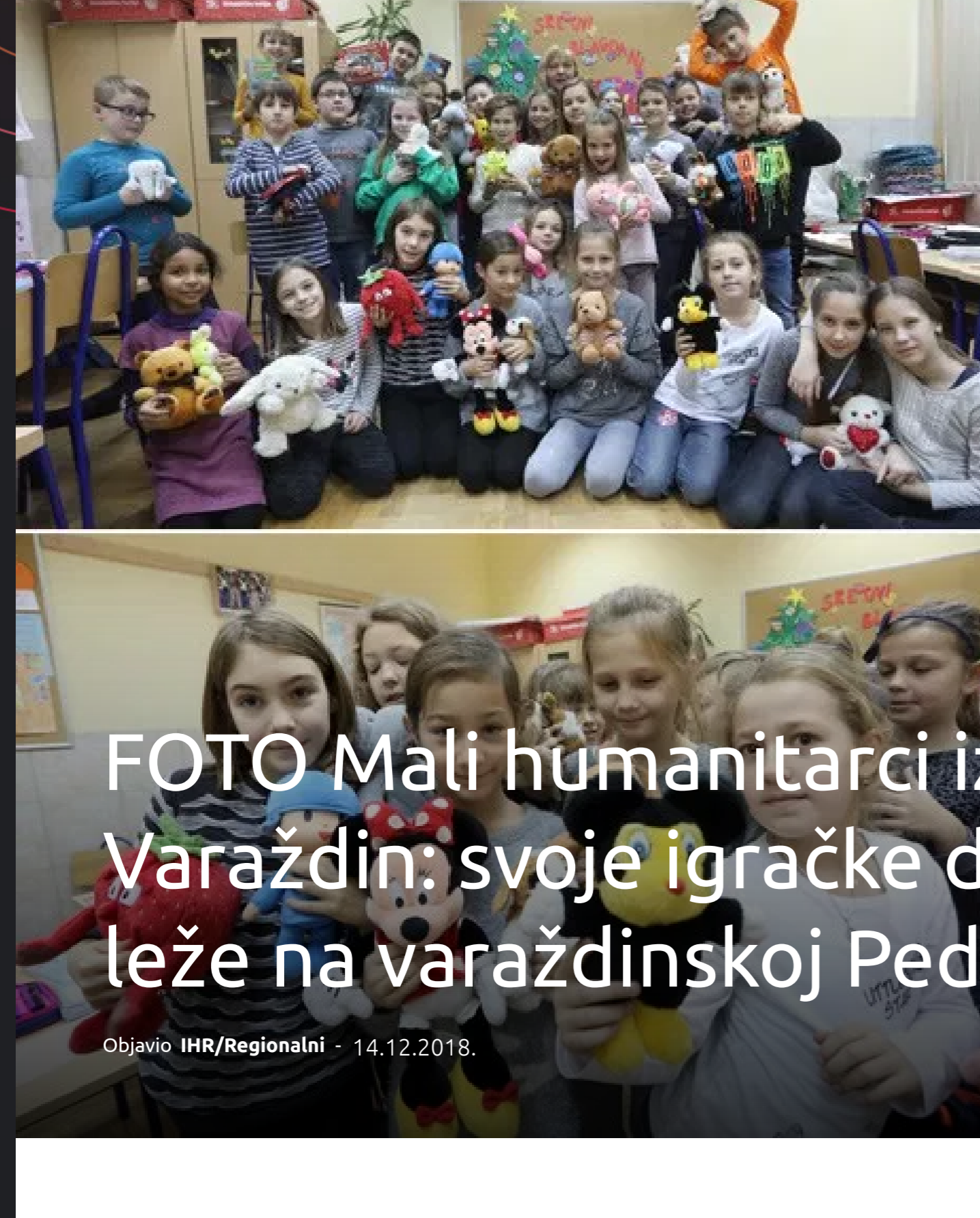
FOTO Mali humanitarci iz 3. c VI. OŠ Varaždin: svoje igračke darovali djeci koja leže na varaždinskoj Pedijatriji